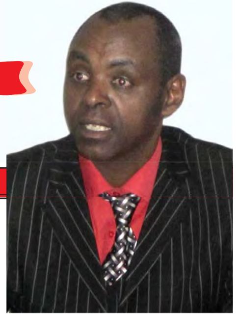
ከቶ ጥላሁን እንደሻው