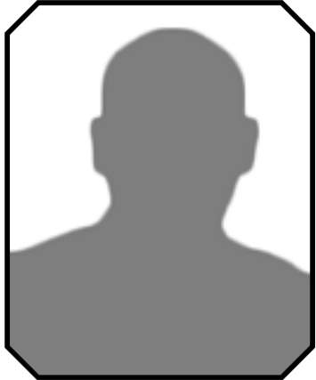
አ/ር ዘለቀ ረዲ

ይህንን ጽሁፍ ለመጻፍ ያነሳኝ በፍፍተ ነጻነት ጋዜጣ ላይ እንደ የካርቱን ስልል በማጭናት ነው። በዚህ ጋዜጣ ላይ ያዩሁትን የካርቱን ስልል ሞገሮና ቀንበር የተሸከሙ ገበሬዎችን የክልሉ ፕሬዚዳንት በመጥረጊያ እየጠረጉ “ወደ አገራችሁ ሂዱ” እያሉ ከደቡብ ክልል ሲያባርሯቸው “ሀገራችን የት ነው?” ብለው ሲጠይቁ የሚያሳይ ነው። ይህንን የክርቱን ስልል ስመለከት በእርግጥ የእነዚህ ገበሬዎች ብቻ ሳይሆኑ “የኢትዮጵያዊ ሁሉ ሀገሩ ወዴት ነው?” የሚል ሀሳብ በውስጡ ተመላለሰ እና ለመጻፍ ተገደድኩ። ይህንን ለማለት ያስገደደኝ ደግሞ ሁለት ምክንያቶች አሉ።